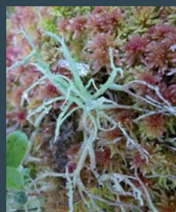
Das bedeutende Grosswaldreservat trägt zur Förderung der Artenvielfalt bei – Torfmoos mit Flechte.