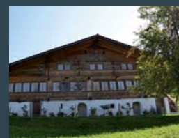
Die Baukultur mit dem typischen Streusiedlungscharakter ist mit dem Wacker-Preis ausgezeichnet – das Jünihaus in Bächten ist eines der ältesten Häuser im Diemtigtal.