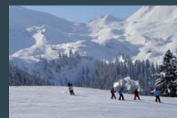
Das Diemtigtal bietet alle Möglichkeiten für sportliche Winteraktivitäten im familiären Ambiente.