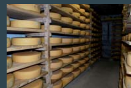
Alpkäse konsumieren bedeutet die Berglandwirtschaft erhalten.